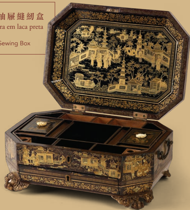
漆木描金抽屜縫紉盒 Caixa de costura em laca preta dourada Gold Lacquer Sewing Box

“藏珍薈萃——澳門博物館成立二十周年館藏展”亦是慶祝澳門博物館成立二十周年的系列活動之一，從館藏文物中挑選出八十多件 / 套甚具觀賞價值與歷史意義的珍品展示，整個展區分為“嶺南丹青”、“歐邦畫旅”、“習尚風行”、“多元共融”、“展覽回顧”和“教育展區”六大部分，從中介紹澳門自十六世紀以來，其在傳承中華文化傳統之外，也因西人遠至而首得風氣之先，開啟了中西文化交往歷時四百多年的佳話，展覽