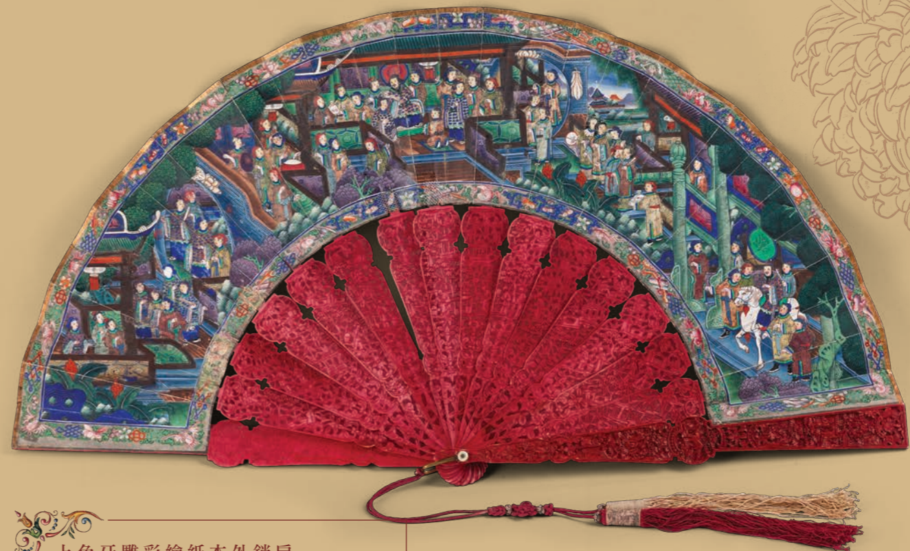
上色牙雕彩繪紙本外銷扇 Leque de exportação com escultura em marfim e papel com desenho colorido Export fan with ivory carving and colored drawing paper

O Museu de Macau foi inaugurado em 1998 pelo que este ano comemoramos o seu 20.º aniversário. Ao longo destes anos procuramos mostrar o singular encontro cultural entre Oriente e Ocidente e proporcionar exposições de dimensão considerável, nomeadamente “De Versalhes à Cidade Proibida — Gravuras da Coleção do Museu de Louvre”; “Uma Viagem através da Luz e da Sombra — A Invenção da Fotografia e as Primeiras Fotografias de Macau, China”; “Uma Dança Arrojada — A Festa do Dragão Embriagado em Macau”; “Viagem Aos Confins do Mundo — Michelle Ruggieri e os Jesuítas na China”; “A Rota Marítima da Porcelana — Relíquias dos Museus de Guangdong, Hong Kong e Macau”; “Colotipia · Retorno — Perspectivas Convergentes de John Thomson e Wong Ho Sang”; e, mais recentemente, “Tesouro do Mar Profundo — Exposição de Relíquias Arqueológicas Subaquáticas de Nanhai N.º 1” inaugurada a 18 de Abril do corrente ano, exactamente no dia em que o Museu completou vinte anos. Estas exposições possibilitam um conhecimento mais profundo das especificidades históricas de Macau e de outros povos cujos percursos decorreram em contextos culturais diversos.