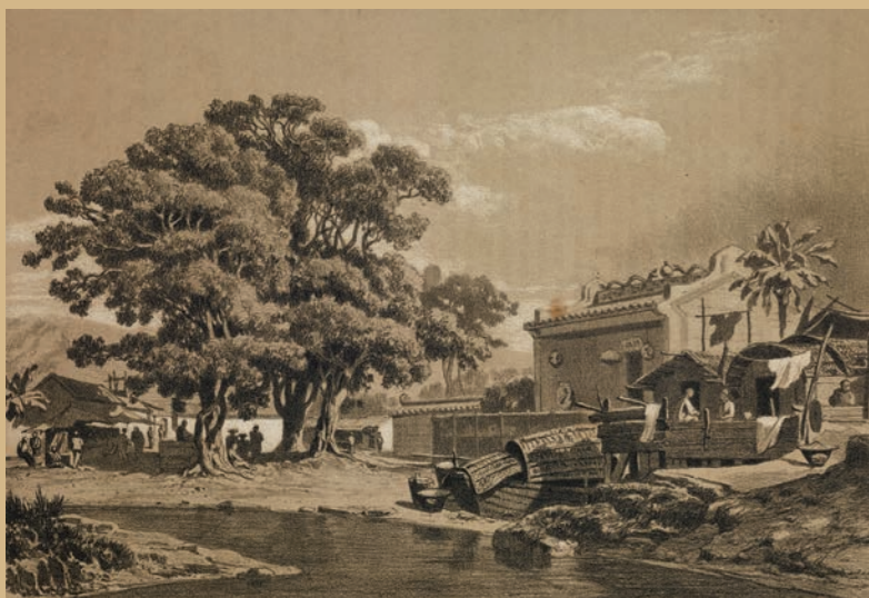
澳門白色屋舍旁的廟宇 Templo e Edifício Branco Temple beside White Building

澳門博物館自一九九八年建館至今已屆二十年，長期以來，澳門博物館一直展現澳門作為中西文化交匯獨特文化的重要平台。過去，澳門博物館曾經舉辦過多場大型展覽，包括“從凡爾賽到紫禁城——羅浮宮館藏銅版畫展”、“凝光攝影——攝影術的發明暨中國澳門老照片”、“醉舞龍騰——澳門魚行醉龍節”、“海國天涯——羅明堅與來華耶穌會士”、“海上盜路——粵港澳文物大展”、“珂羅·重現——湯姆遜與黃豪生的光影對接”等，以及於今年四月十八日澳門博物館成立二十周年館慶當天，舉辦的“深藍瑰寶——南海 I 號水下考古文物大展”。這些展覽展示澳門的歷史面貌，也講述來自不同國家地區的人民，在不同文化背景下的交流及生活情況。